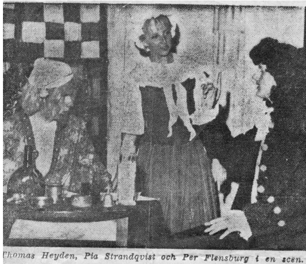
Fig 27. Jag längst till höger som Beralde, den inbillade sjukens bror, som tvivlade på läkarvetenskapen.

Vi spelade pjäsen för publik på en riktig teater och det skrevs om den i tidningen och vi fick bra recensioner trots att vi pratade skånska. Så vi fortsatte även terminen därpå och gav då "Den inbillade sjuke" av Molière. Även i denna uppsättning var jag med och spelade Beralde, den