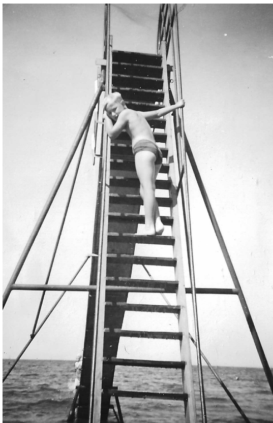
Fig 11. Jag på stranden i Båstad. Jag gick aldrig högre upp på stegen.

Det enda jag kommer ihåg från småskolan i Malen var att jag var livrädd för att behöva prata med de andra barnen. Varför vet jag inte, men jag gick alltid för mig själv. Det fanns utrymme mellan skolan och ett uthus som låg bakom skolan och där brukade jag hålla till under rasterna, för dit kom ingen. Fast en gång kom en liten kille dit och undrade vad jag gjorde. "Jag letar efter mask" sa jag och då hjälpte han mig. Det var tydligen ett uppskattat nöje för någon dag senare föreslog han mig att vi skulle gå och leta mask. Men jag slingrade mig från det på något vis. Då klassen fick veta att jag skulle flytta gjorde de ett fint häfte med teckningar som jag fick. Tror jag fortfarande har det kvar.