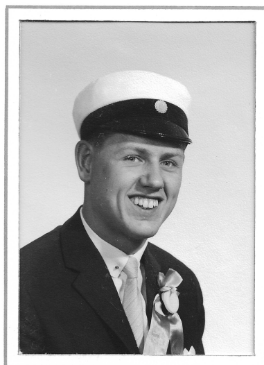
Fig 29. Jag med studentmössa.