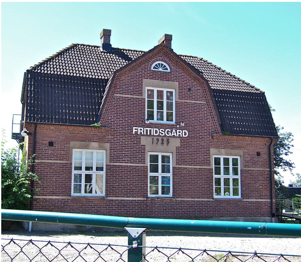
Fig 19. Småskolan i Strövelstorp. Den blev flyttad till en ny skolbyggnad och den gamla skolan blev fritidsgård. Lärarinnan bodde på övervåningen.