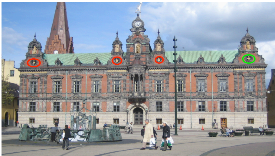
Fig 1. Rådhuset i Malmö. I grön ring finns en byst av Mathias Flensburg.

Om man står framför rådhuset i Malmö ser man bysterna av fyra gubbar högst upp. I bilden nedan är de inringade.