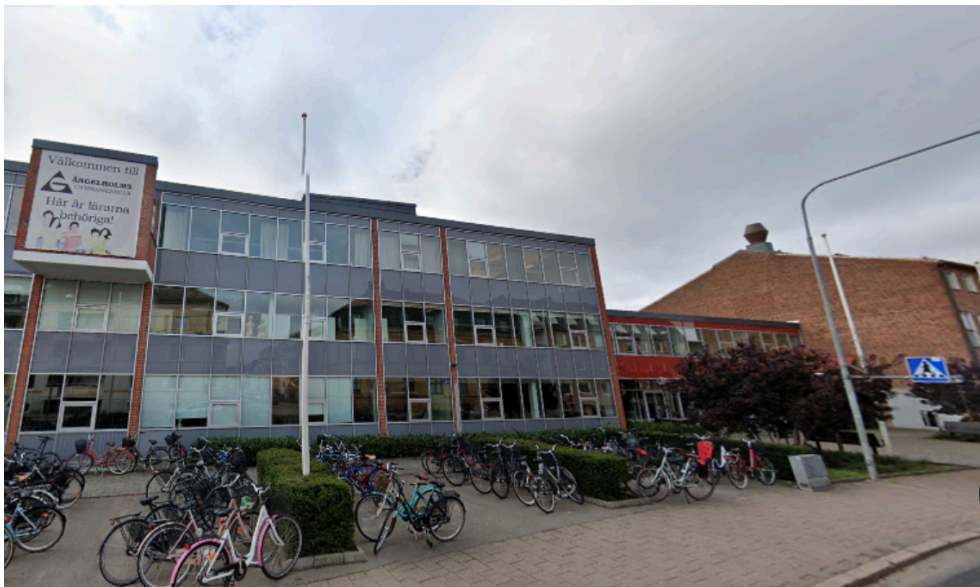
Fig 25. Ängelholms gymnasium som det såg ut på 60-talet. Den röda byggnaden fanns inte och den blågrå var ungefär så stor som på bilden. Längst till höger skimtar den gula byggnaden som då var gymnasium.