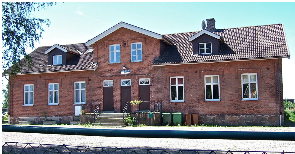
Fig 20. Storskolan i Strövelstorp Till vänster fanns klassrum för mellanskolan och storskolan, till höger bodde läraren.