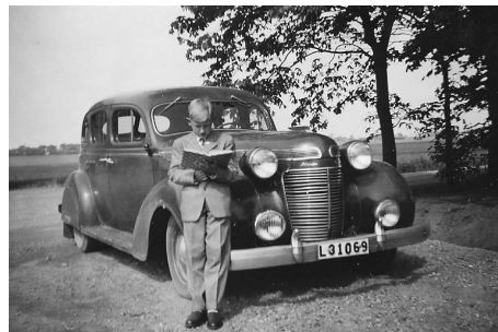
Fig 12. Vår andra bil: En Chrysler från 1937.