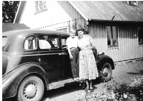
Fig 11. Vår första bil, troligen sommaren 1954.