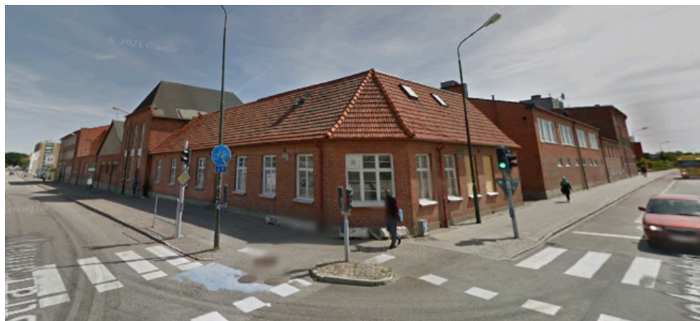
Fig 32. Addos äldsta byggnad på Industrigatan i Malmö. Hela kvarteret tillhörde Addo.

hade en som hade räknat dygnet runt i, jag tror det var 10 år och han ville se den plastburk som höll så länge. Jag kunde köpa en Addo-X maskin till samma pris som de anställda: 3 000 kr vilket jag faktiskt gjorde. Men vid någon flytt åkte den på skroten stort sett oanvänd.