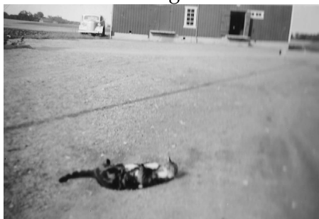
Fig 14. Två katter som leker på gårdsplan och vår första lastbil parkerad bredvid kvarnen.

Men efter några år köpte Sune en gammal militärbil med fyrkantiga skärmar och som var camouflagemålad. Vi målade över den med en ljusgrå färg och bilen fick göra tjänst åtskilliga år. Men den blev till sist ersatt med en riktig lastbil med tipp och allting. På bild 14 ser man den stå vid sidan om kvarnen.