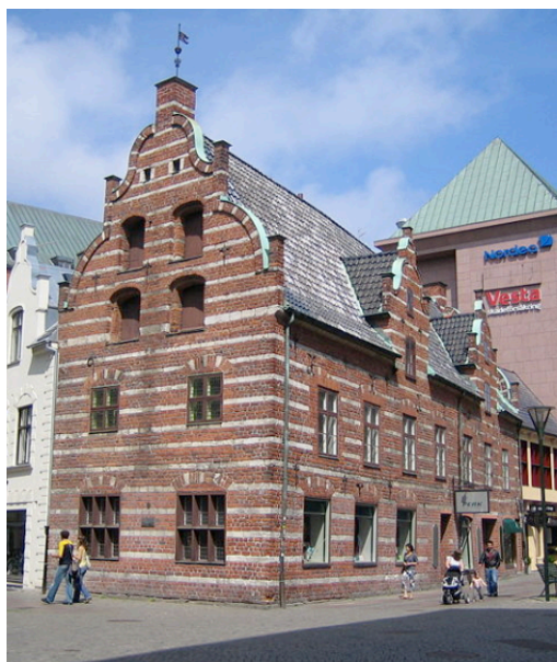
Fig 2. Flensburgska huset i Malmö.