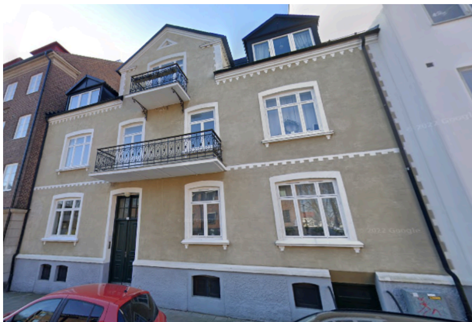
Fig 8. Erik Dahlbergsgatan 5, Helsingborg. Jag bodde i våningen högst upp.