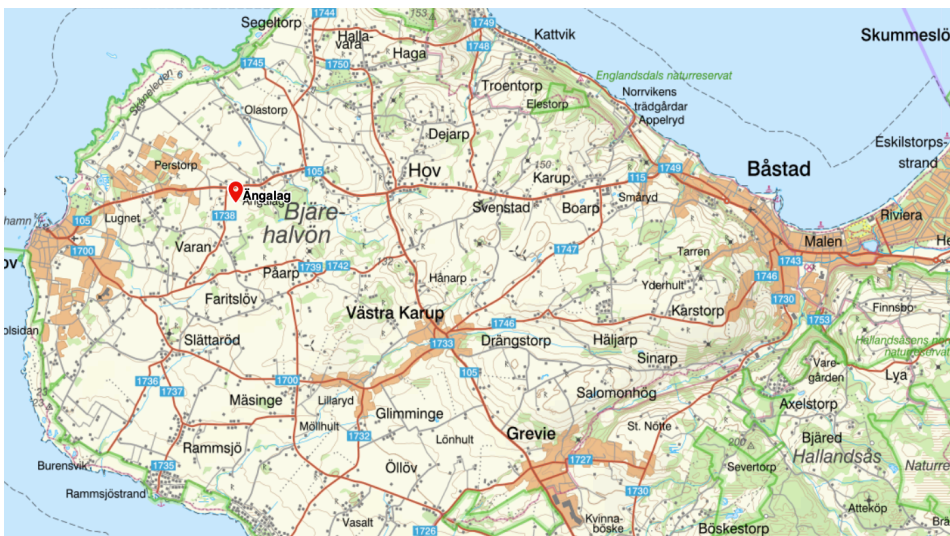
Fig 9. Karta över Bjärehalvön där Ängalag är markerat.