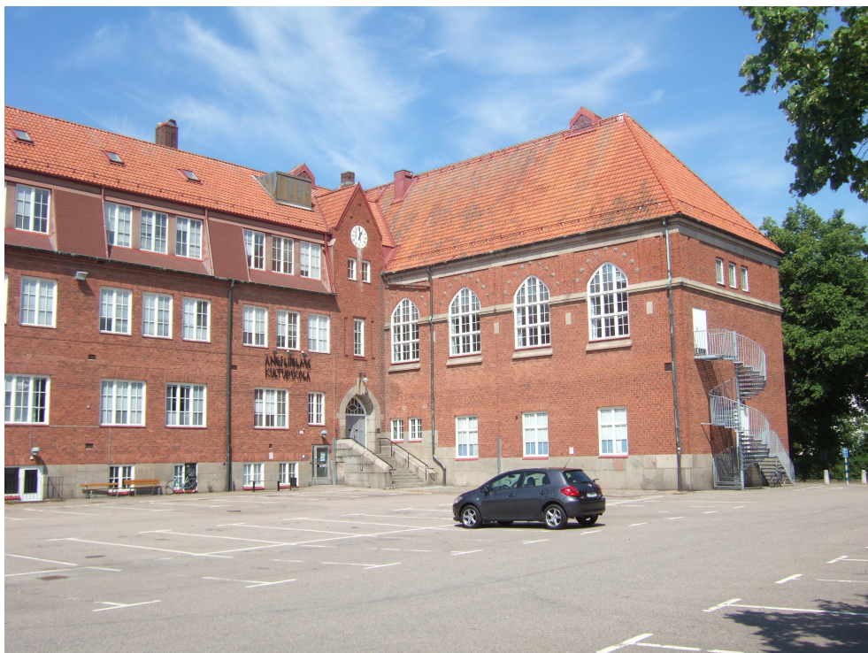
Fig 21. F d Ängelholms Högre Allmänna Läroverk, numera Kulturskolan