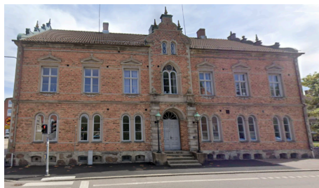
Fig 24. Gamla skolan i Ängelholm.

Högre allmänna läroverket i Ängelholm bestod vid denna tiden av tre byggnader: Huvudbyggnaden som vi ser på fig 21 där det fanns realskola, aula, gymnastiksal och matsal. Sedan fanns den gamla skolan (uppförd 1894) där det i huvudsak var förvaltning men det fanns också ett par klassrum på nedre botten (fig 24). När jag gick i 2 4 hade vi vårt klassrum där. Bakom gamla skolan fanns gymnasiet, ett modernt trevånings i gult tegel. Innerväggarna i korridoren var gjorda av perforerat tegel vilket gjorde att det nästan inte fanns något eko. Det gjorde att ljudnivån var behaglig även om det kändes som om man hade bomull i öronen.