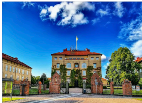
Fig 30. Dåvarande kanslihuset på P6.

Regementet låg i Näsby i utkanten av Kristianstad. Det är numera nerlagt och Högskolan Kristianstad har istället sina lokaler där. Det var en helt ny värld man trädde in i med helt nya och alldeles oeftergivliga regler. Jag hade inga större problem att anpassa mig och lyda, det var jag van vid sedan tidigare, men det fanns dem som absolut inte kunde stå ut med att bli kommenterade att stå i givakt eller att göra honnör åt alla befäl. Dessa borde ha blivit utsorterade tidigare men ett par stycken blev det nu.