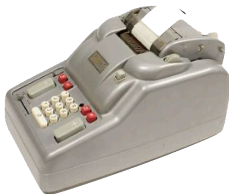
Fig 31. Mekanisk räknemaskin från Addo.

Addo gjorde mer än bara räknemaskiner men i Malmöfabriken var det dessa som gällde. Sommaren 1966 köpte Facit sin konkurrent Addo, men de fortsatte som självständiga bolag. Facit var då på väg in i en kris, som ledde till att hela koncernen, inkl Addo, såldes till Elektrolux som snabbt lade ner tillverkningen av räknemaskiner. Jag tror det var sommaren 1971 som jag var nattvakt där och det märktes tydligt att företaget hade sett sina bästa dagar. Det var i huvudsak två orsaker till detta. Facit och Addo fortsatte att vara konkurrenter istället för att samarbeta. Och så naturligtvis de otympliga och dyra räknemaskinerna som ersattes av små billiga räknedosor. Företaget hängde inte med i denna utveckling för ledningen blev egentligen aldrig informerad om hur läget var. Jag pratade med en av jobbarna på fabriken och frågade just om räknedosorna men han skrattade och sa att de där små plastburkarna inte skulle hålla länge medan Addos maskiner var sega. De