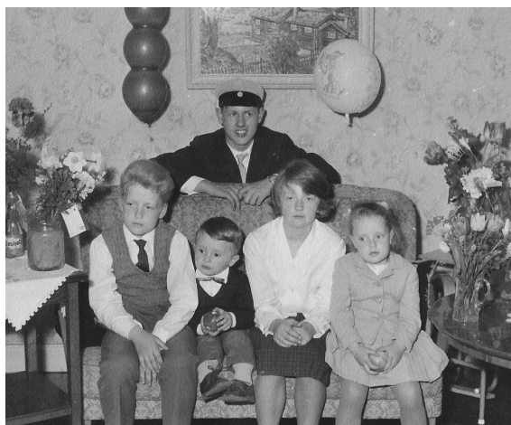
Fig 23. Nybliven realist uppvaktat av måttligt glada kusiner.