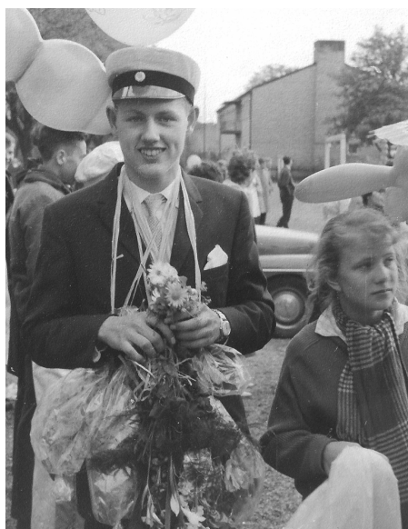
Fig 22. Utsläppt med real-examen.

Efter kortegen åkte vi hem, jag fick en massa blommor och pengar. Och ballonger! Jag tror vi åt något men kommer inte ihåg vad och så dracks det kaffe och åts tårta. Fast jag drack inte kaffe då så det blev lemnad istället. Efteråt skulle det tas kort och det var