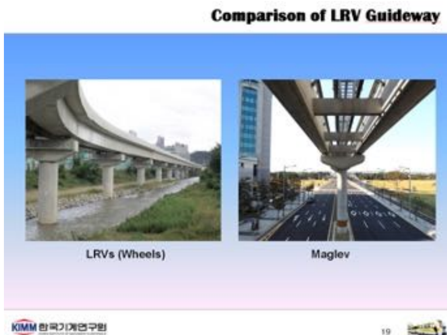
Figur: En jämförelse mellan brokonstruktioner för LRV(Light Rail Vehicle)-tåg till vänster och magnetstågsbana till höger.

En indikation på styrkan i den internationella utvecklingen av magnetåg är fakta om de 18 nya typer av magnetågsbagnar som har producerats i världen de senaste tre åren, främst i Kina (Kenji Eiler, The International Maglev Board, 2022-04-08).