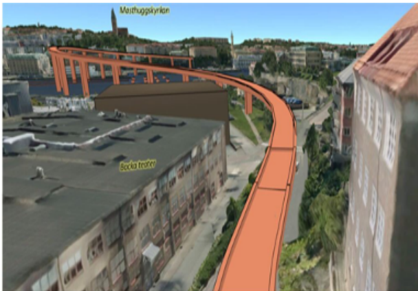
27-meter hög bro enligt Stadskontoret Göteborg

des på dessa epoker och tiden före industrialiseringen. I mångt och mycket ett genomarbetat verk, men inte i fas med nutida vetande. Sedan det skrevs har arkeologer, etnologer, historiker och geografer med flera fört fram ny kunskap om såväl äldsta som modern tid.