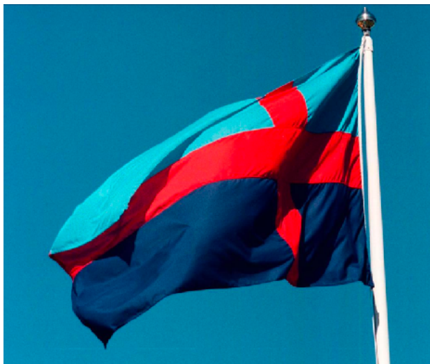
Bohusläns Flagga.

logerna på SVT/SR vars inställning är en annan. De använder samtliga Sveriges landskap i sin vokabulär och talar om Bohuslän (landskapet) eller västkusten (kusten) när det ena respektive det andra åsyftas. Efter regionbildningen 1998, då Göteborgs och Bohus län upphörde, har oskicket att förenkla och radera i geografin tilltagit. Utan förleden "Göteborgs" och länstermens tyngd återstår det nakna landskapet utan sitt gamla fäste i rikets administration. Men även på andra och djupare sätt försvinner, bit för bit, det som vi har definierat som något bohuslänskt.