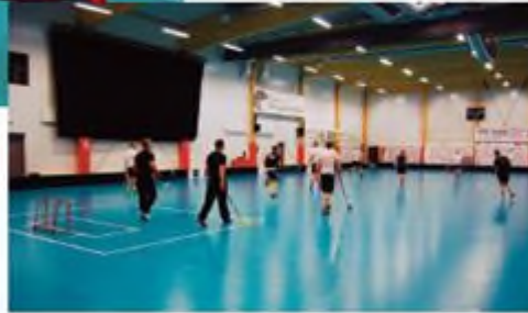
The Penticostal Church, Gavle, Sweden

Many churches have identified their problems: the need for business differentiation and increased need for professionalization. Various churches are testing new venues to offer service in order to reach out. At the same time, this is a way of getting their budget in balance. The churches have already stated to build service centers, food courts, sports stadiums, concert halls, schools, etc.