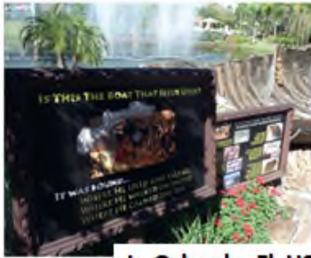
In Orlando, Fl, USA

Churches of all kinds came to the United States with immigrants from Europe. Today American churches pay major influence on the European religious situation. A large number of new churches have arisen. New Age and alternative movements of various types have supplemented the European ecclesiastical geography.